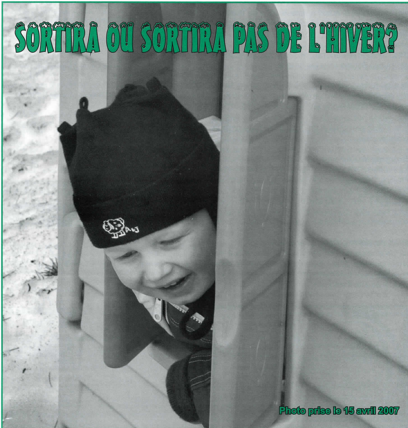
Photo prise le 15 avril 2007